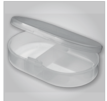
Cajita extraíble para pequeño material.