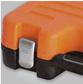
Cierres metálicos robustos y simples de usar con mecanismo de muelle.