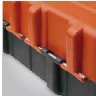
Bisagras fuertes que dan una mayor duración a la caja.