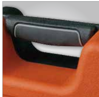
Asa bimaterral para un perfecto y cómodo agarre.